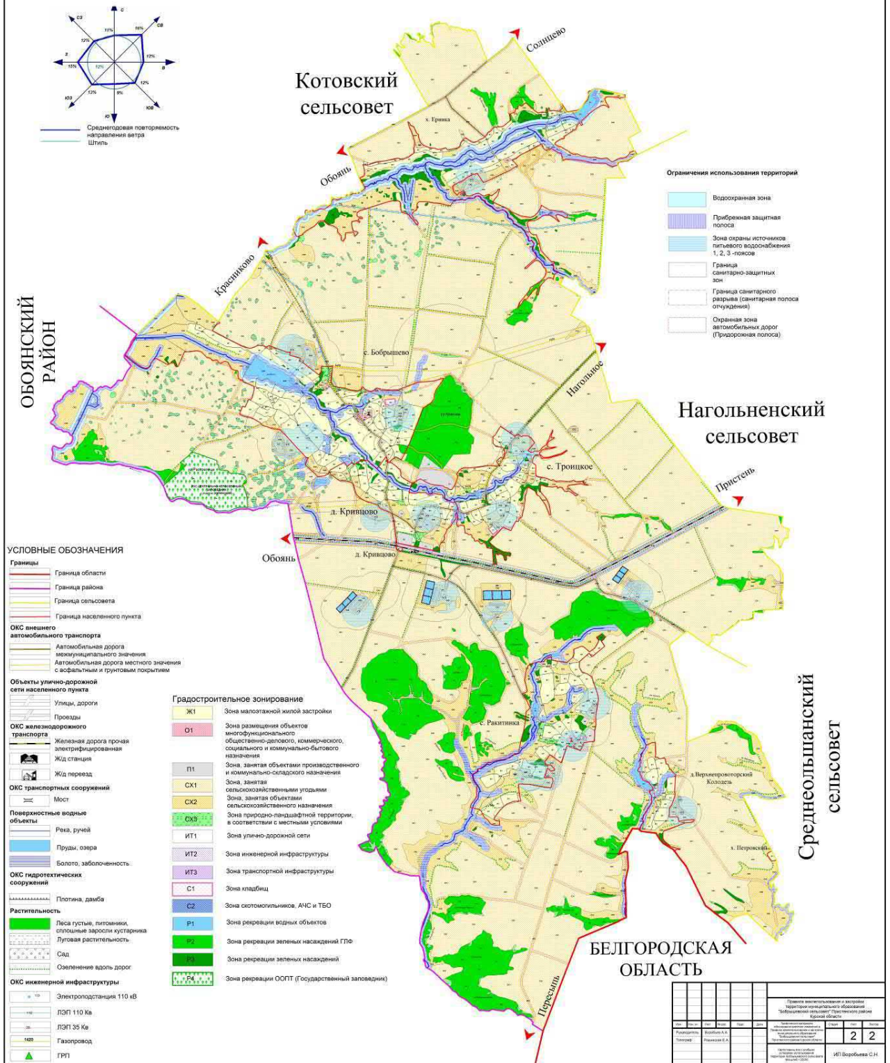
Рис.2. Карта границ зон с особыми условиями использования территории муниципального образования «Бобрышевский сельсовет» Пристенского района Курской области